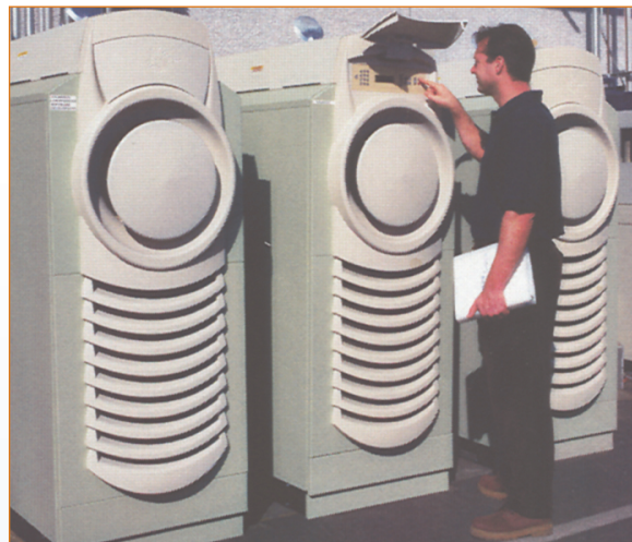
Tres microturbinas de 30 kilovatios que operan con gas de vertederos en California (Estados Unidos).

La meta de la Asociación Methane to Markets es desarrollar proyectos que aprovechen estas oportunidades de captura y uso de metano. Los gobiernos nacionales, junto con el sector privado, los bancos de desarrollo y otras organizaciones interesadas colaboran a través de esta asociación para hacer posible los proyectos y lograr los beneficios relacionados con el clima, la economía y la salud pública.